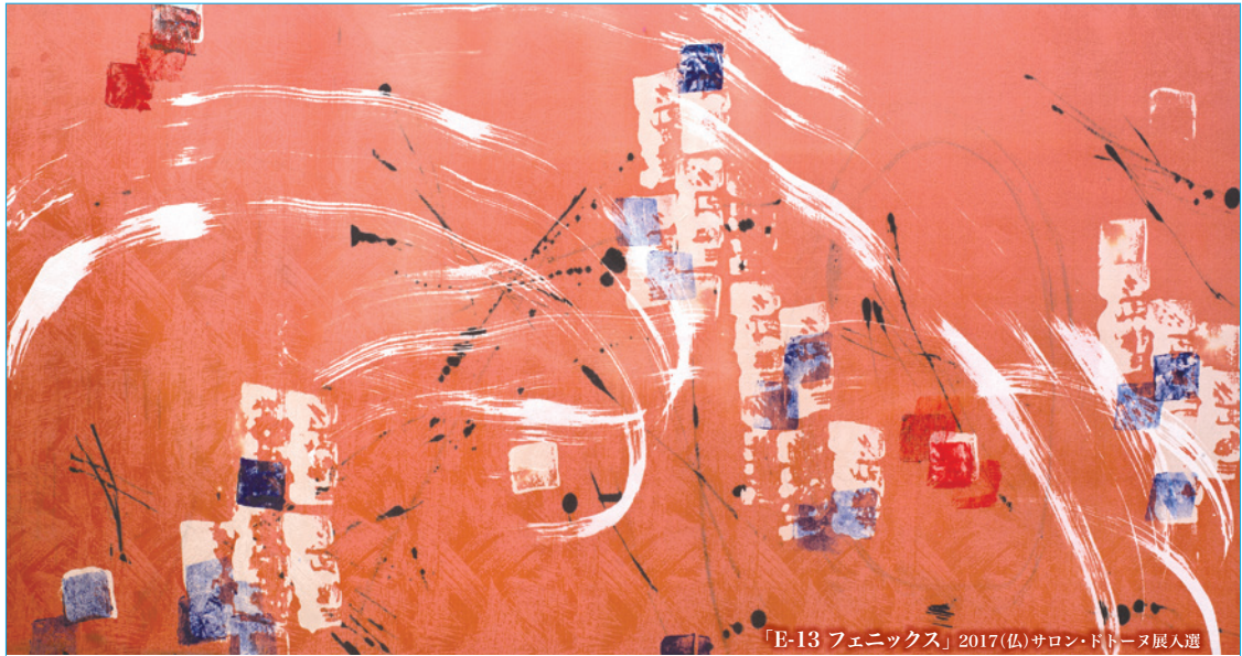
「E-13 フェニックス」2017(仏)サロン・ドトローヌ展入選